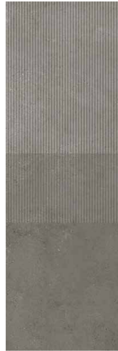
85900-2 B Grey