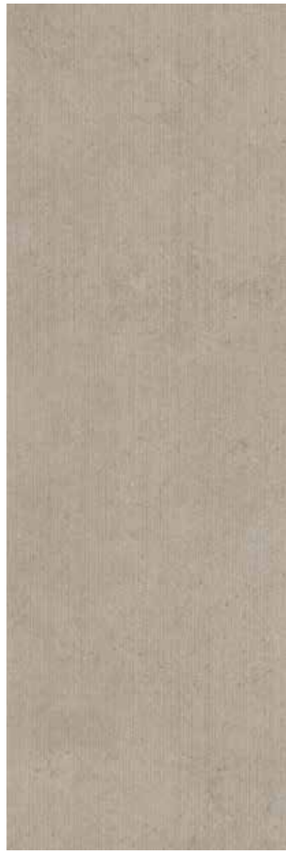
85900-1 A Beige