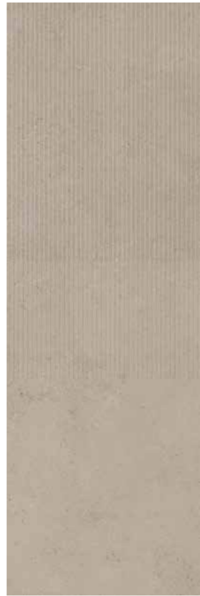
85900-2 A Beige