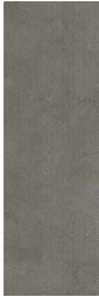
85900-1 B Grey